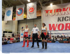
( Dünya 3.sü Öğrencimiz )