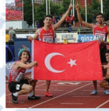
( Avrupa Şampiyonu Öğrencimiz )